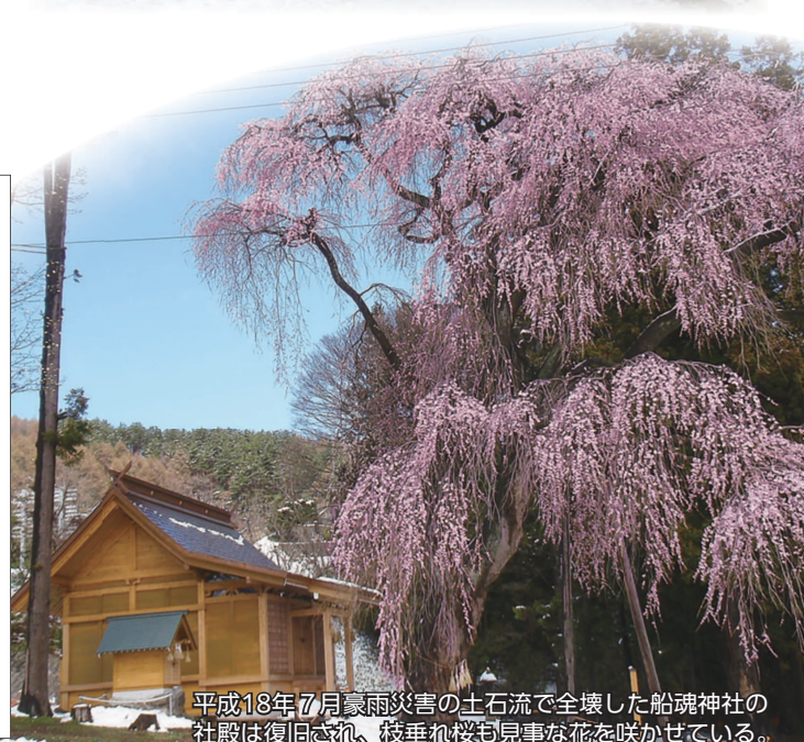
平成18年7月豪雨災害の土石流で全壊した船魂神社の社殿は復旧され、枝垂れ桜も見事な花を咲かせている。

本シンポジウムは、平成18年7月豪雨災害から20年を迎える節目に、当時の経験と教訓に加えて本地域に伝わる災害の記録をあらためて振り返るとともに、次世代へどのように伝えていくべきかを考えるものです。諏訪6市町村それぞれの記録を共有し、将来に向けた持続的な安全・安心の備えを地域全体で考える場とします。